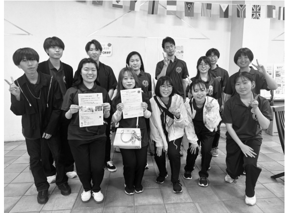
『やさしい日本語部』のみなさん

私たち『やさしい日本語部』は、2022年度に、現在の3年生が設立しました。設立のきっかけは「将来医療職者になる本学の学生がやさしい日本語について学ぶことで、より良い医療やケアの提供につながるのではないかと考えたことです。3年目に突入した現在は計14名で活動しています。