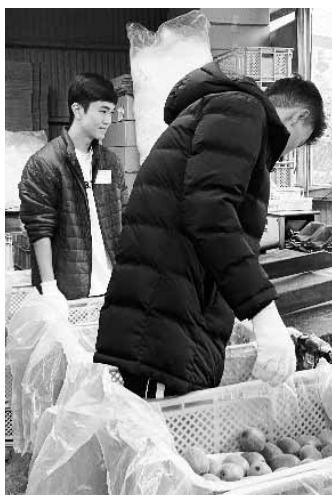
▲ ニッポ_キウイフルーツカンントリー

参加した生徒からは「日本語の勉強が大切だと感じた」「どんな仕事に就くにしても勉強が必要だと感じた」といった感想があり、勉強の大切さや「働く」ということについて自分なりに考えるための、良い機会とすることができました。