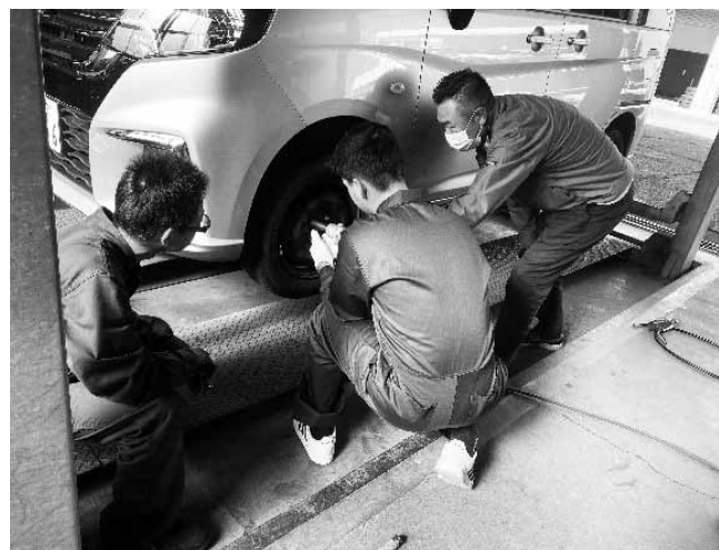
▲ ソヒゾ_街長尾モータース